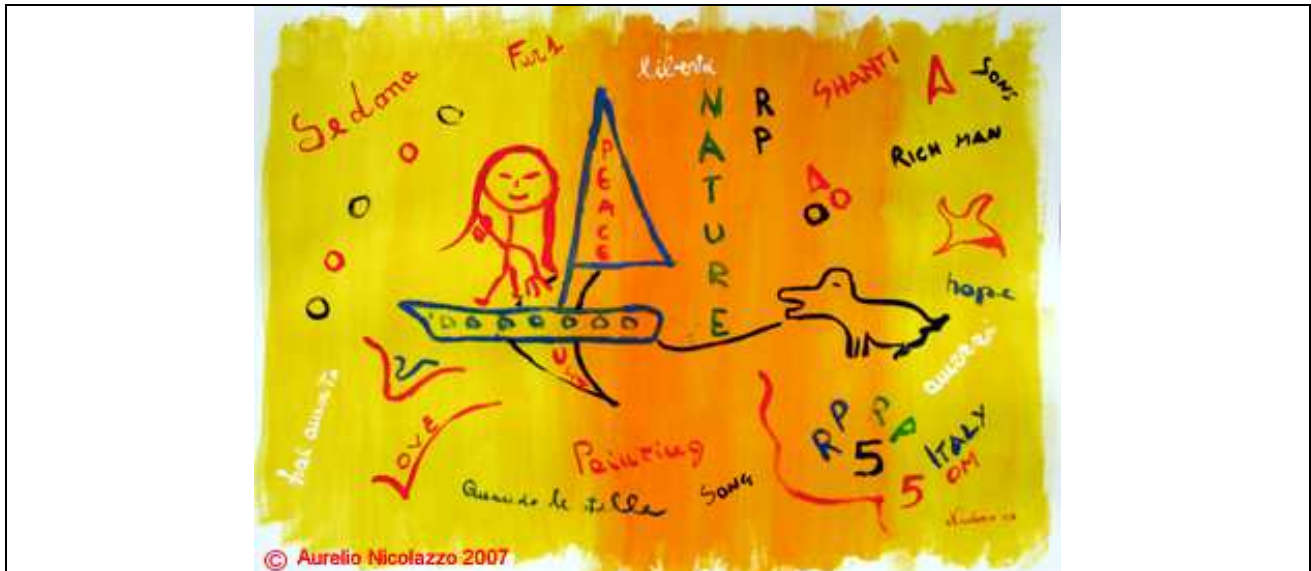
2007, "Lazzaro World 2", graffiti-art