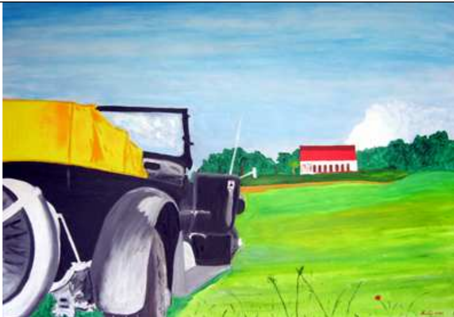
2008, "Fuori Città"