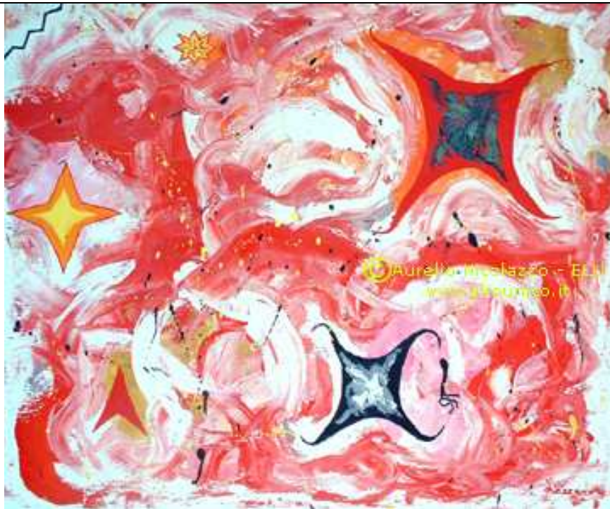
2006, "Over Number 1"