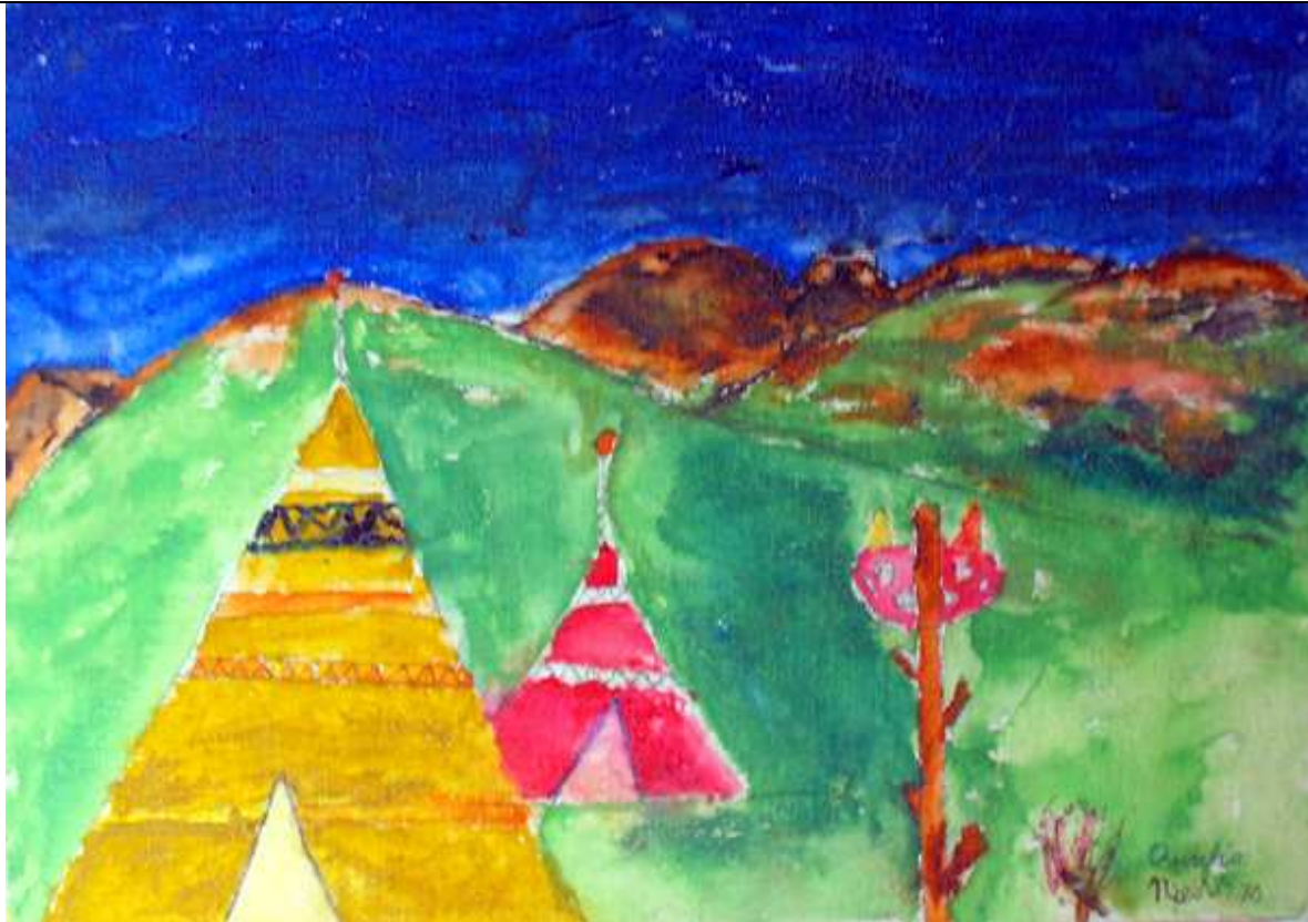
“Campo Indiano”, acquerello su cartone telato, 1970 circa