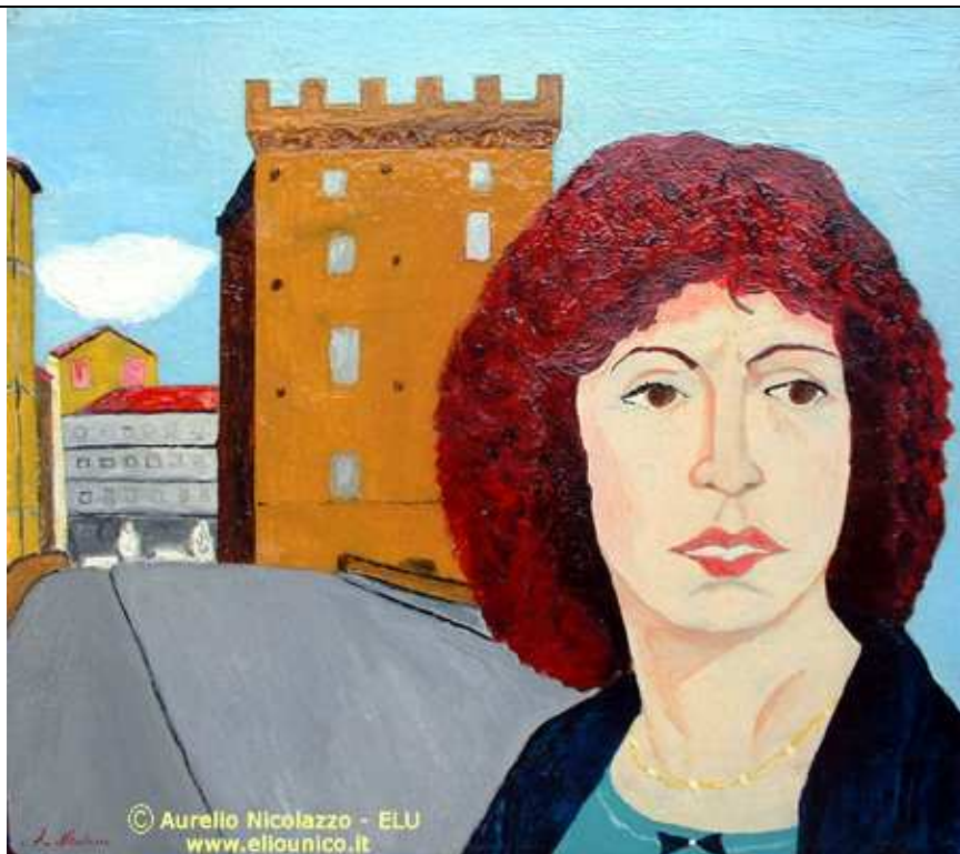
1995, "Athina Cenci e Firenze"